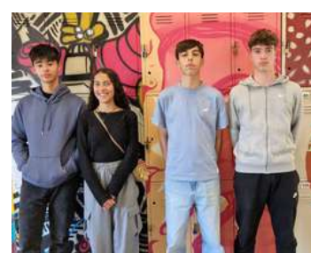
Prova, Vencedores e Lanche