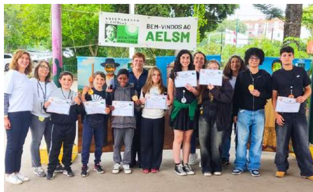
Vencedores do Jogo

O evento destacou-se pelo entusiasmo, espírito desportivo e motivação dos alunos, além de fomentar estratégias de cálculo mental e promover um convívio saudável entre estudantes e professores. | CD MAT